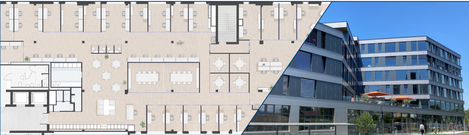
Plan intérieur des locaux